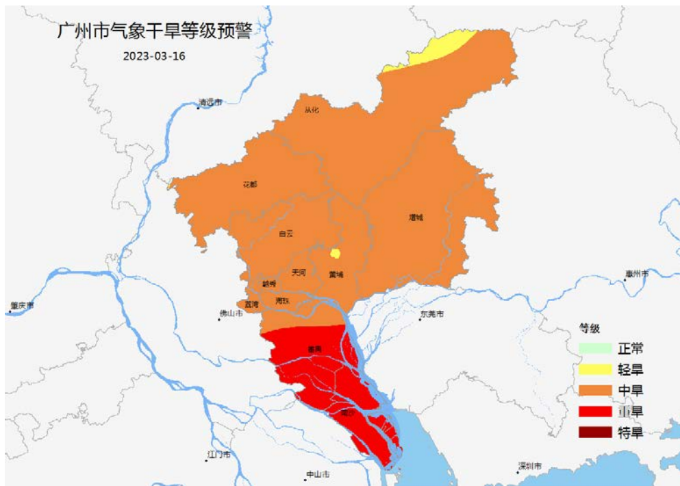
图1 2023年3月16日广州市气象干旱等级预警分布图

过去一周（3月10日~3月16日），我市平均气温 21.4^{\circ}\text{C} ，较近十年同期偏高 2.6^{\circ}\text{C} ；平均累计日照时数30.8小时，较近十年同期偏多58.8%；无降雨。光温条件有利于春耕春播的开展，但降雨持续偏少，土壤湿度偏低，气象干旱继续发展，目前我市大部分地区出现中度气象干旱，番禺、南沙有重度气象干旱。