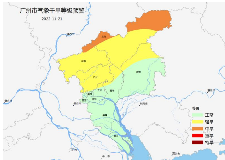
图 1 2022 年 11 月 21 日广州气象干旱等级监测分布图

过去一周（11 月 14 日~11 月 20 日）过去一周我市平均气温 24.6℃，较近十年同期偏高 3℃；全市平均累计日照时数 28.4 小时，较近十年同期偏少 5%；全市平均累计降水量 0.8mm，较近十年同期偏少 77.8%。目前我市北部地区有轻度气象干旱，光温条件总体有利于晚稻的收获晾晒，对作物生长及开展冬种有利。