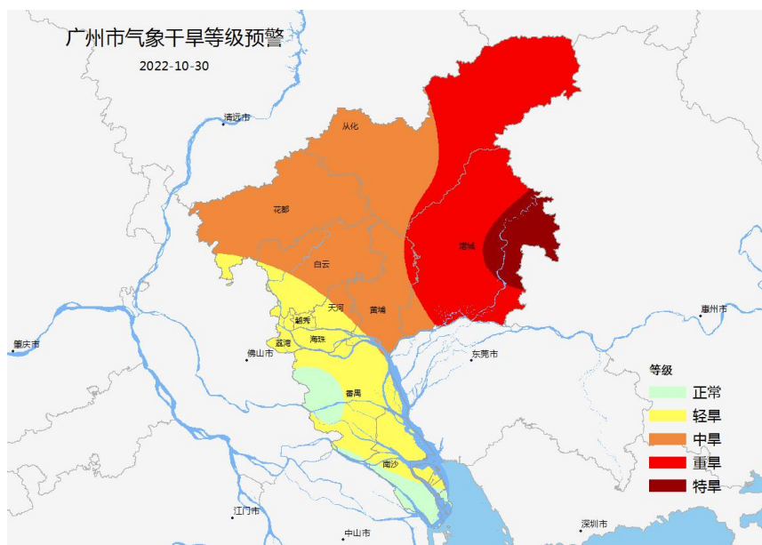
图 1 2022 年 10 月 30 日广州市气象干旱等级监测分布图

过去一周（10月24日~10月30日），我市平均气温 24.9^{\circ}\text{C} ，较近十年同期偏高 0.7^{\circ}\text{C} ；平均累计日照时数59.5小时，较近十年同期偏多50.6%；全市平均累计降雨量0.0mm，较近十年同期偏少100%。周内气象干旱进一步发生发展，全市各区出现不同程度的气象干旱，其中增城东部发展为特旱（图1）。总体评价农业气象条件一般。