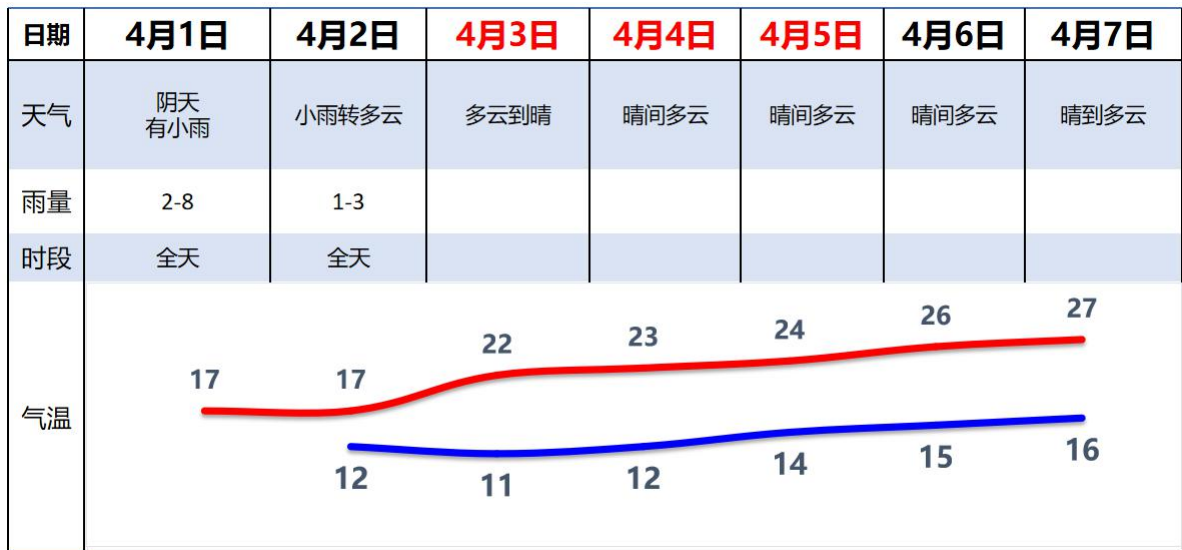
图 2 广州市未来一周天气预报