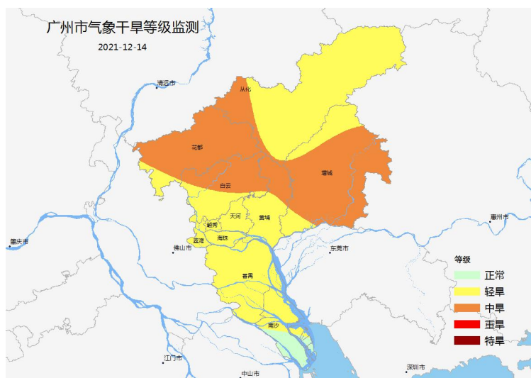
图 2 2021 年 12 月 14 日广州市气象干旱等级监测分布图